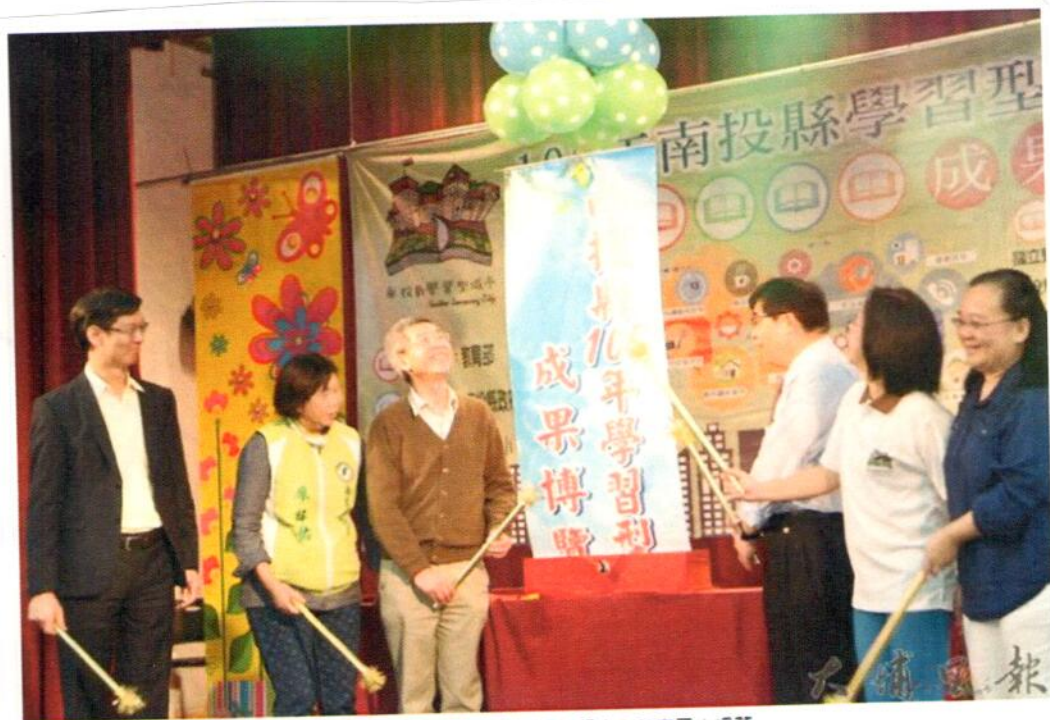
南投縣105年學習型城市成果博覽會在草屯國小揭幕。