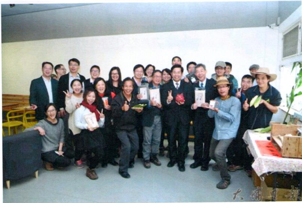
教育部吳普文忠（前排手持紅龍果者）至埔里瞭解人文創新與社會實踐計畫推行的情形，會後與各單位及耆農合影， （柏原祥 攝）

註：暨大近年來因應地方發展需求，陸續設立相關系所，更於105學年度正式設置校級「水沙連人文創新與社會實踐研究中心」，專責大學與地方協力治理工作，扎根駐點在桃米、藍城、眉溪部落，另積極協助福興社區推動夜間課輔、蜈蚣社區發展低碳社區、南村社區之社區營造，並積極與各個社團合作推動水沙連區域PM2.5空污減量運動、村里環境營造、環保寺廟、生態城鎮轉型、友善交通等各項工作，扮演著城鎮發展的協力者。