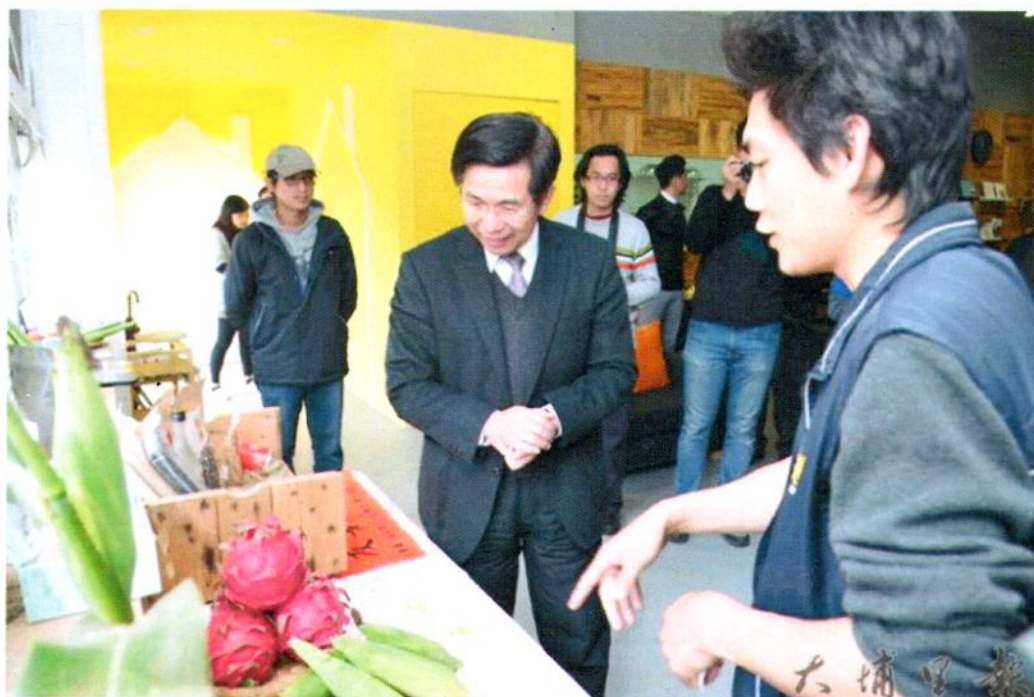
教育部長潘文忠至埔里瞭解人文創新與社會實踐計畫推行的情形，在地耆農介紹芋種的的農作。

暨大資管系副教授戴榮賦則介紹近年來推動的PM2.5微型偵測器，透過遍布於學校、寺廟、社區居家微型監測器，得以瞭解空氣汙染物質流向，甚至透過數據分析，還能得出九份二山的阻隔，讓東側埔里盆地空汙物質難以擴散，西側的空汙物質沉積在山腳下，學術在地實踐的過程，不但找到書本沒寫的問題面向，還延伸新的知識系統，獲得寶貴的經驗與傳承，對此潘文忠相當肯定暨大的付出。