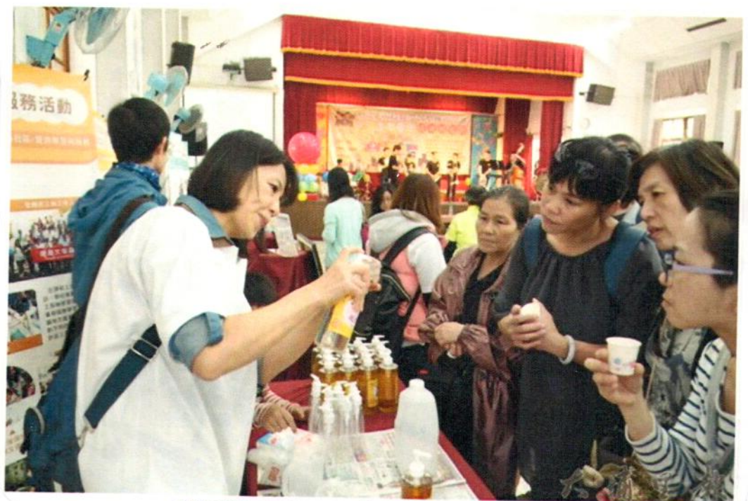
參與學習型城市博覽會的代表們，示範檢丁聯業毒藥劑的用法。

暨南大學教授兼任教育部全國性學習型城市領航計劃主持人的吳明烈表示，全國自2年前開始積極推動學習型城市計畫，去年共有7個縣市入選標竿縣市，南投縣是一，今年又有10個縣市入選，2年來南投縣推動計畫相當積極創新，提高縣民終身學習參與興趣，課程內容及人數方面都有大幅成長，暨大也朝無邊界大學目標邁進，帶動個人、地方發展及產業創新，期許邁入第3年之際，打造樂學、樂業、樂活、樂居的標竿城市，讓南投成為全國學習型城市典範。