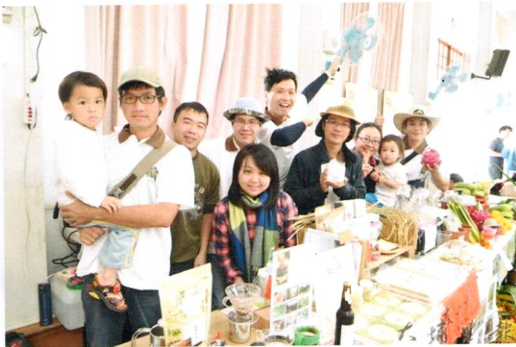
來自大埔里地區的小農們帶來自產的加工品，展現熱情與活力。