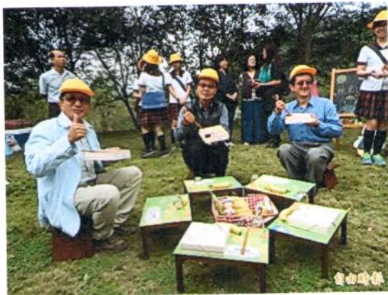
針對停留4至6小時遊客設計的「桃米遠足」，遊客自製輕食餐盒，進行社區小旅行，體驗遠足郊遊樂趣。