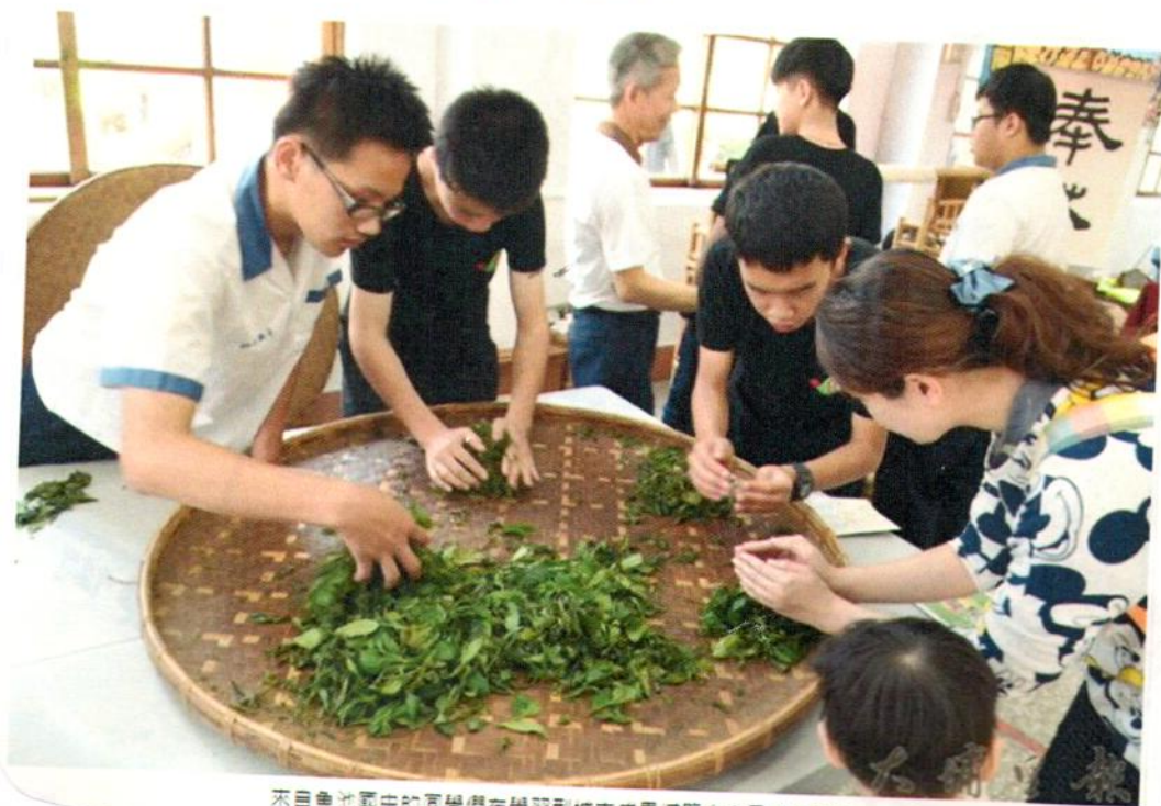
來自各地區中的同學們在學習型城市成果博覽會中動手採茶。

縣府指出，推動相關經驗將逐步擴散到13鄉鎮市，期待藉由點線面的擴充與連結，讓整個南投都是我們的學習據點，如欲了解本縣學習型城市的相關資訊，可參考「南投縣學習型城市網站」（網址： http://www.lcn.org.tw ）· 2016-12-26 13:35:23