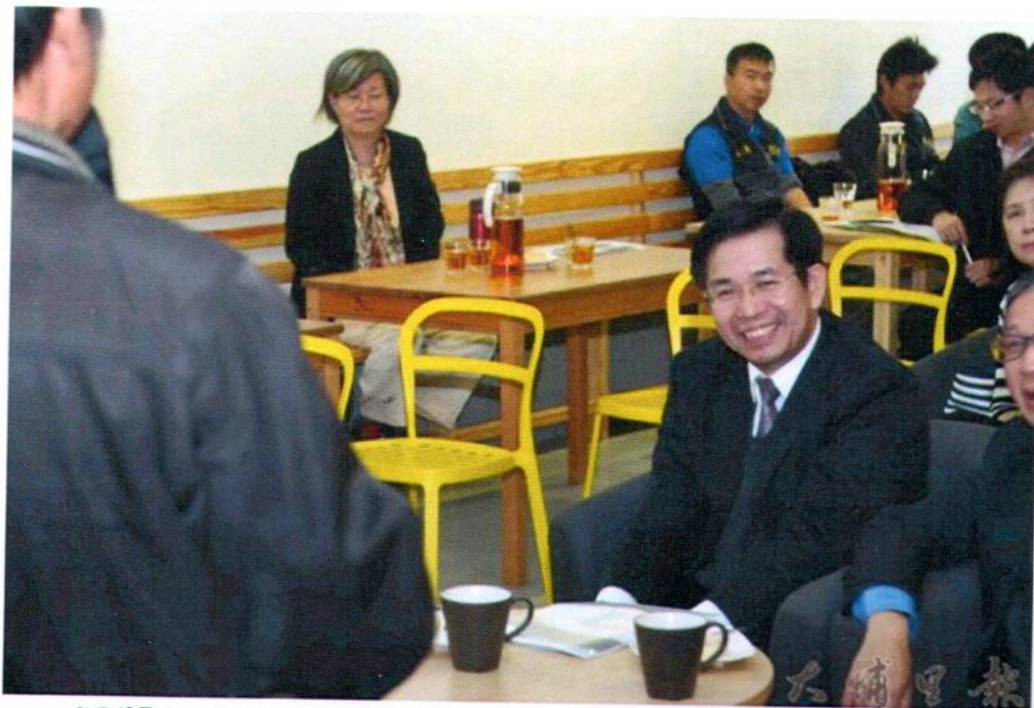
教育部長潘文忠至暨大與埔里鎮桃米社區，瞭解人文創新與社會實踐計畫推行的情形。

【柏原祥 / 埔里報導】教育部長潘文忠30日至暨大參訪人文創新與社會實踐計畫成果，他除了肯定暨大跳脫學術框架，跨域治理外，也指出「人才不能出了社會才開始覺得有社會責任」，大專院校投入在地實踐雖不容易一步到位，但教育部會鼓勵更多大專院校投入資源，培養一流的公民社會人才。