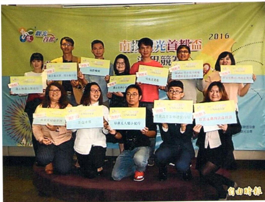
2016 南投觀光首都盃遊程競賽獲獎的在地社團，縣府將媒合旅行社協助包裝推廣行銷。(記者佟振國攝)

日期=105年12月22日 標題=南投觀光首都盃 今成果發表與通路 媒合 來源=自由時報