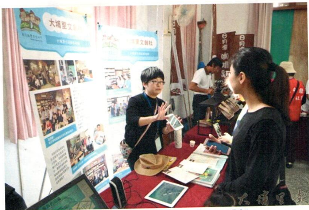
來自埔里的《大埔里@報》也參與學習型城市計畫，培訓在地公民記者。

105年南投縣學習型城市計畫以「打造綠活城鎮從《投》學習」為發展願景，秉持生態與宜居的原則，深耕推動學習新城市的內涵，部門資源結合，扮演終身學習樞樑，執行計畫團隊包括暨南大學人社中心、南投縣大埔里文創協會、魚池鄉公所、魚池國中、水沙連社區大學、廣福國小、大埔里地區觀光協會、桃米休閒農業園區推廣協會、南投民宿觀光協會、魚池鄉東光社區發展協會、新故鄉文教基金會、大埔里@報等11個協辦公民營組織，分別以活動、沙龍、工作坊、教學等型態開設了416小時的課程，吸引超過15000人次的民眾參與學習，縣民學習管道更為多元，讓學習融入日常生活之中。