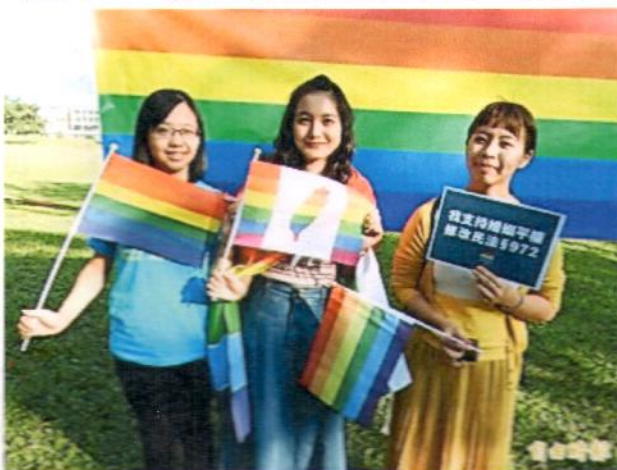
暨大同學揮舞彩虹旗幟及舉支持婚姻平權修改民法的看板，表達立場。(記者佟振國攝)

日期=105年12月14日 標題=暨大學子挺婚姻平權 高掛彩虹旗 來源=自由時報