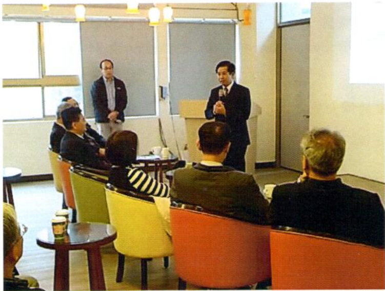
教育部潘文忠部長參訪暨大人文創新與社會實踐計畫推動情形

暨大作為南投縣唯一的國立大學，近年來不僅因應地方發展需求，陸續設立相關系所，更於105學年度正式設置校級「水沙連人文創新與社會實踐研究中心」，專責大學與地方協力治理工作。不僅扎根駐點在「桃米社區、籃城社區、眉溪部落」，同時也積極協助福興社區推動夜間課輔、蜈蚣社區發展低碳社區、南村社區之社區營造等事宜。並積極與各個社團合作推動水沙連區域「村里環境營造、PM2.5空污減量運動、環保寺廟、生態城鎮轉型、友善交通」等各項工作，扮演著城鎮發展的協力者。